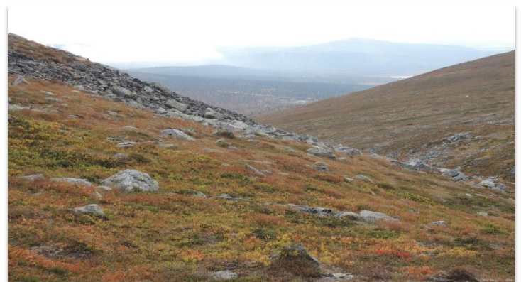
Taivaskeron ja Laukukeron retkellä saattoi ihaila Vatikurua ja takaa hämmöttävää Pallas-hotellia

Iltaisin ohjelma jatkui hotellilla. Vanha elokuva ensimmäisestä Pallas-hotellista ennen sotaa kertoi funkkishotellin erikoisuuksista: monet suihkuhuoneet, upeat kalusteet ja viihtyisät, ylelliset oleskelutilat. Hotelli oli aluksi omavarainen jopa maidon ja sähkönkin suhteen. Lapin sodassa hotelli tuhoutui.