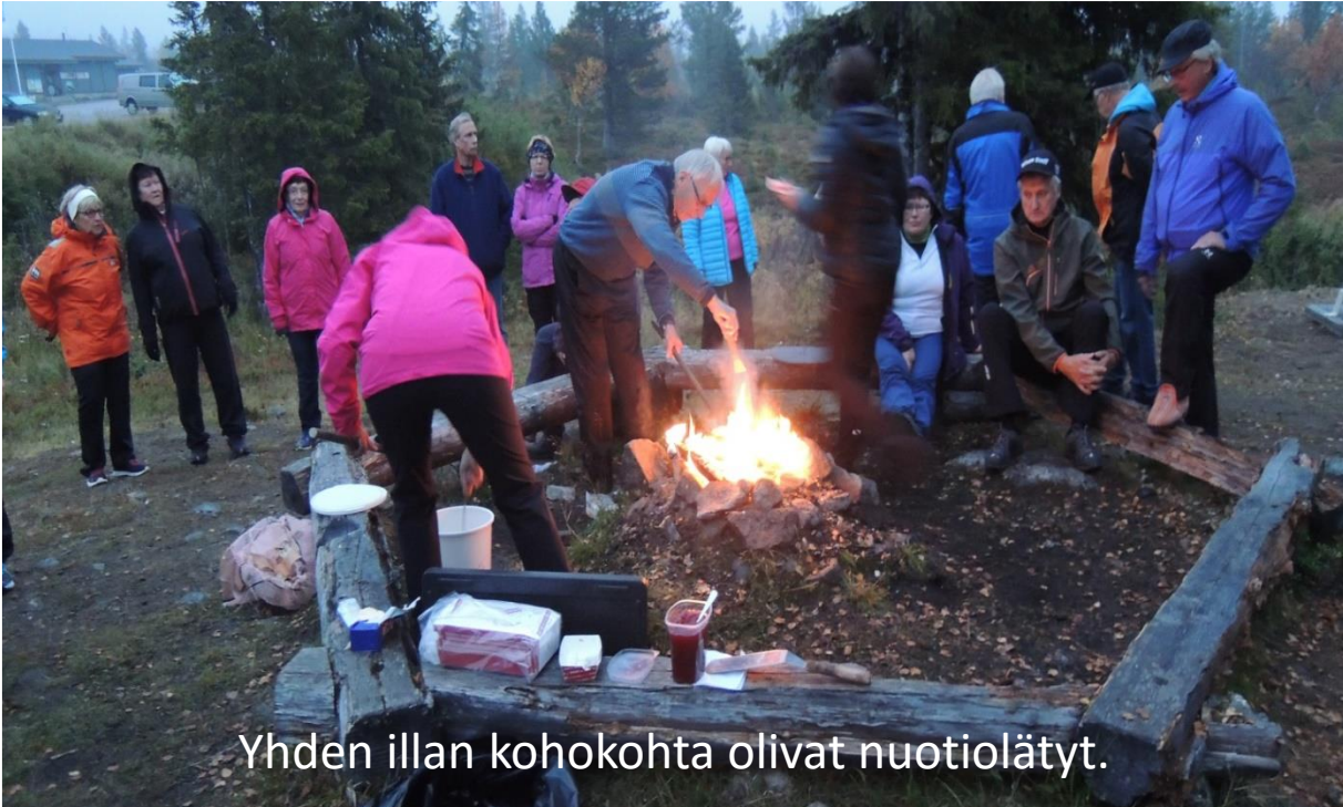
Yhden illan kohokohta olivat nuotiolätyt.