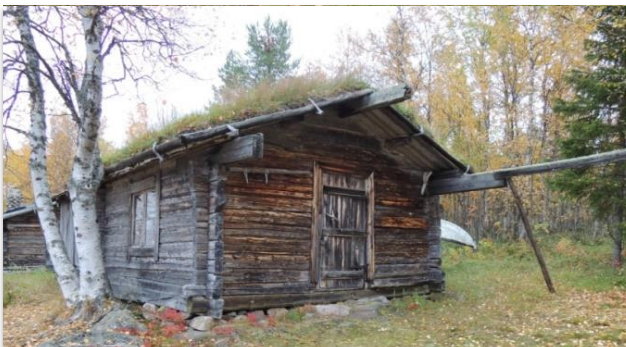
Jerisjärven rannalla tutustuttiin 1700-luvulta peräisin oleviin kalamajoihin. Kalastajat olivat juuri perkaamassa komeaa siikasaalista.