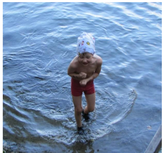
Talviuintikauden avaus Ahvenistolla 11.10 houkutteli mukaan myös nuorempia uimareita